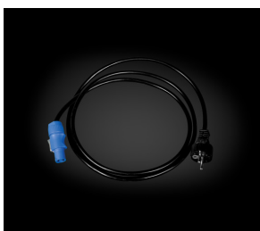
Сетевой кабель PowerCon

Для использования Power Shot необходимы следующие аксессуары (приобретаются отдельно):