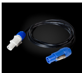
Соединительный кабель PowerCon